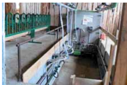
Salle de traite