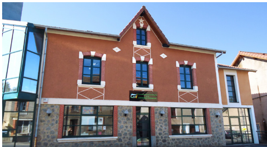
Siège de la Communauté de communes