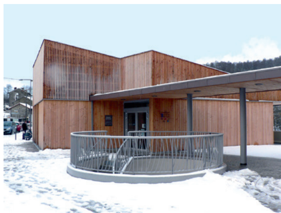
Pôle Enfance Jeunesse Tourisme

Implantée sur la commune de Celles-sur-Durolle, la chaufferie bois plaquettes installée sur ce site assure également le chauffage du siège de la communauté de communes par l'intermédiaire d'un réseau de chaleur.