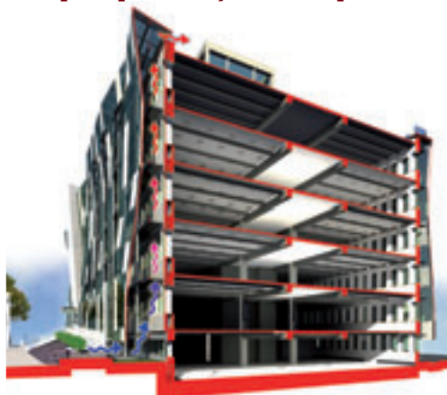
Usages thermiques de la double-peau

Une façade double-peau est constituée d'une paroi extérieure entièrement vitrée et d'une paroi intérieure plus massive. Le principe de la façade double-peau est le même que celui d'une serre, en revanche elle ne propose pas d'espace habitable.