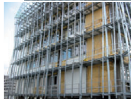
Montage seconde façade et isolation extérieure