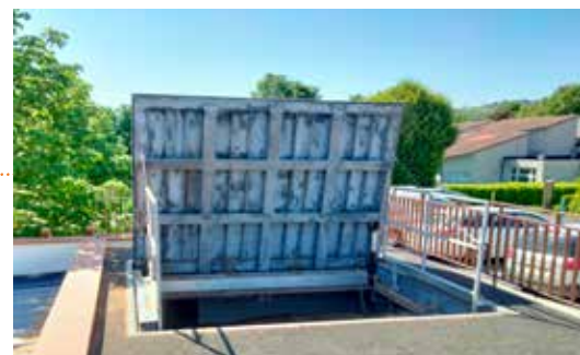
Trappe du silo de stockage