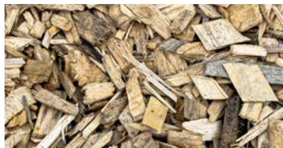
Combustible bois plaquettes

La production des plaquettes de bois est issue d'une exploitation forestière bénéficiant du label de gestion durable PEFC, avec un rayon d'approvisionnement maximum de 60 km. Les livraisons se font par camion à fond mouvant de 60 ou 90 m 3 , soit 17 à 26 livraisons par an pour approvisionner la chaufferie bois.