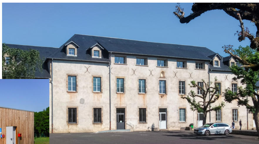
Pôle résidentiel Les 3 Vallées